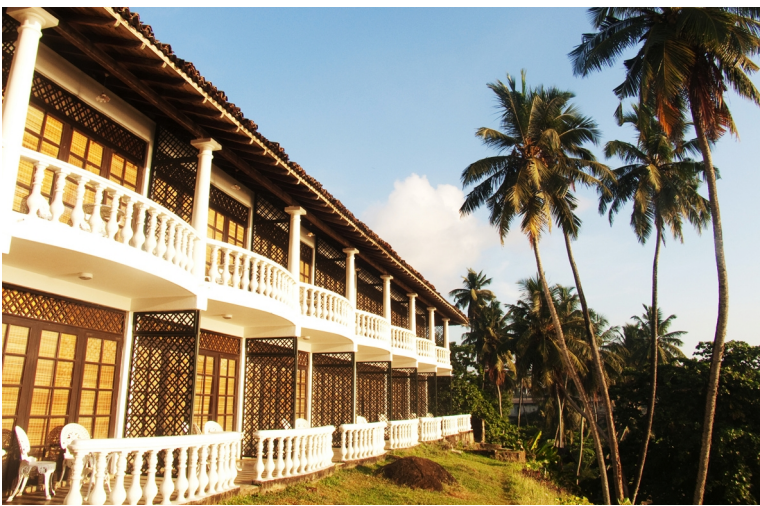
斯里兰卡南部滨海小城加勒

十六至十七世纪为东方著名的商业中心和主要港口。加勒出名并不是因为海滩，而是城堡。加勒古堡已经被列入世界文化遗产名录。在荷兰殖民时期，荷兰人为了显示在斯里兰卡的统治坚不可摧，在加勒建立了一座占地36万平方米的城堡，标准的欧洲风格。